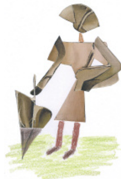
Abbildung 4: Die wartende Frau. Text des Patienten zum Bild (Elfchen): Frau, Regen, Kleid, beschirmt, Tasche, aufgeräumt, ruhig, gelassen, still, vornehm, abwartend

Nun sollte er das betrachtete Bild in eine freie Gestaltung transformieren. Es entstand folgendes Bild, das er «Die wartende Frau» nannte (Abbildung 4).