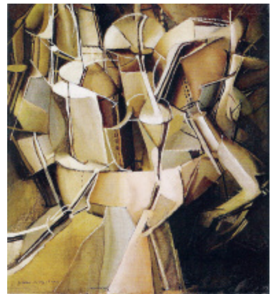
Abbildung 3: Marcel Duchamp («Der Übergang von Virgin in eine Braut»). Text des Patienten zum Bild (Elfchen [3]): Chaos, alles auf einmal, orientierungslos, durcheinander, Arm, Hülle, kopflos, Naht, Unruhe, wild

er inzwischen gekauft hat. Diese Zeituhr solle ihn im Alltag immer wieder daran erinnern, eine Ruhepause einzulegen. Auch mit der rezeptiven (aufnehmenden) Kunsttherapie konnte Herr M. an der Erweiterung seiner Wahrnehmung arbeiten. Seine Aufgabe war, sich aus verschiedenen Kunstwerken jenes auszusuchen, das ihn im Moment am meisten anspricht. Er wählte das Bild von Marcel Duchamp («Der Übergang von Virgin in eine Braut», 1912) (Abbildung 3).