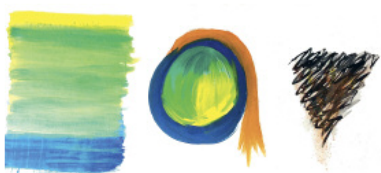
Abbildung 2: Tryptychon

Um die Wahrnehmung zu schärfen und die Grenze zwischen Spannung und Entspannung besser spürbar zu machen, bat die Therapeutin Herrn M., ein Tryptychon zu malen mit den beiden Polen Spannung und Entspannung. Der mittlere Teil blieb für das reserviert, was typischerweise zwischen den Polen liegt (Abbildung 2) M. spielte mit den Farben, malte zunächst die Spannung (rechts), dann die Entspannung (links). Während des Malprozesses näherte er sich immer mehr dem Mittelteil an. Plötzlich sagte er: «Das ist es!» Da-